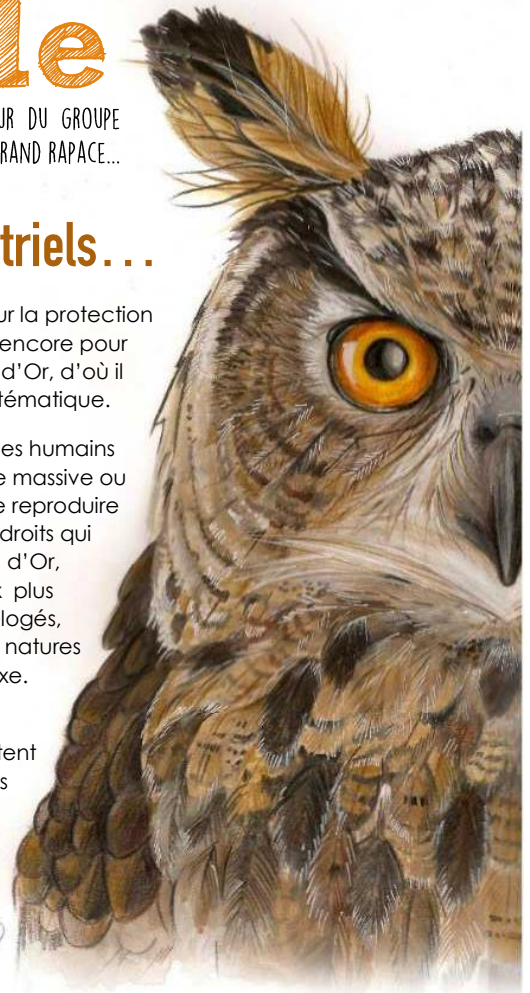
Aquarelle : Aude PHISEL

Je pense que l'on peut accorder notre confiance à ces professionnels qui exploitent à l'explosif les entrailles terrestres pour nos besoins quotidiens (routes, bâtiments...) puisqu'ils y sont attentifs : la meilleure preuve étant celle que le Grand-Duc leur accorde.