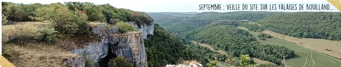
SEPTEMBRE : VEILLE DU SITE SUR LES FALAISES DE BOUILLAND...