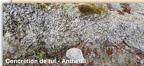
Concrétion de tuf - Antheuil

Les sources tufeuses sont des sources dont l'eau, en circulant à l'intérieur des massifs calcaires, dissout la roche et se charge en calcium et en dioxyde de carbone (CO 2 ). A sa sortie en surface, le CO 2 s'échappe. Il crée alors une réaction chimique qui, en conjonction avec l'action de certaines espèces de bactéries et mousses, conduit à la précipitation de calcaire . Se forment alors, selon la pente, la topographie et la nature du sol où naît cette résurgence, des dépôts plus ou moins compacts appelés tuf .