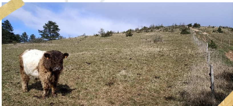
MARS : SUIVI DE L'ÉCOPÂTURAGE SUR LES PELOUSES DE LA MONTAGNE DES 3 CROIX...