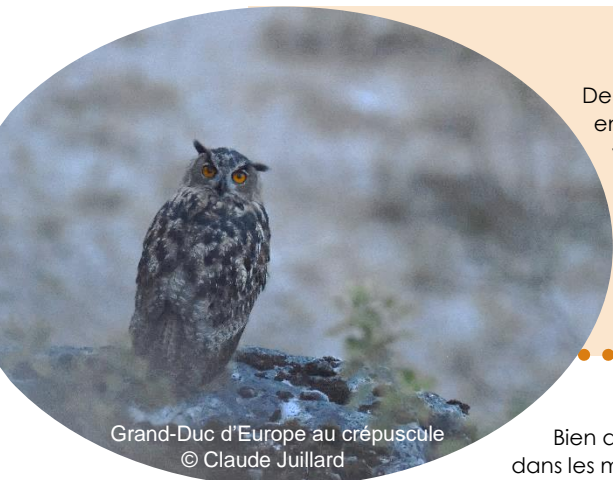
Grand-Duc d'Europe au crépuscule

« Pas rancunier pour autant, c'est auprès des humains et notamment dans les carrières de roche massive ou de granulats en activité qu'il a choisi de se reproduire en nombre. »