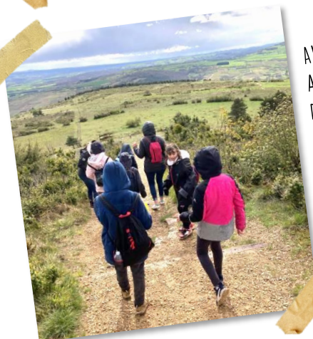
AVRIL : A LA DÉCOUVERTE DES PELOUSES DE LA MONTAGNE DES 3 CROIX AVEC LE CENTRE DE LOISIRS DE DEMIGNY...