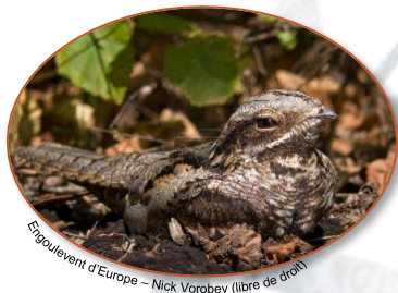
Engoulevent d'Europe

L' Engoulevent d'Europe ( Caprimulgus europaeus ) est une espèce d'oiseaux de la famille des Caprimulgidae. Insectivore, c'est une espèce crépusculaire et nocturne. Il possède un plumage cryptique très complexe, gris, beige et brun, imitant à la perfection l'environnement dans lequel il se repose en plein jour (écorce, feuilles mortes, cailloux...), ce qui lui confère un camouflage efficace de jour comme de nuit.