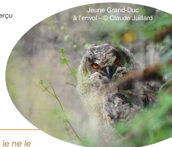
Jeune Grand-Duc à l'envol