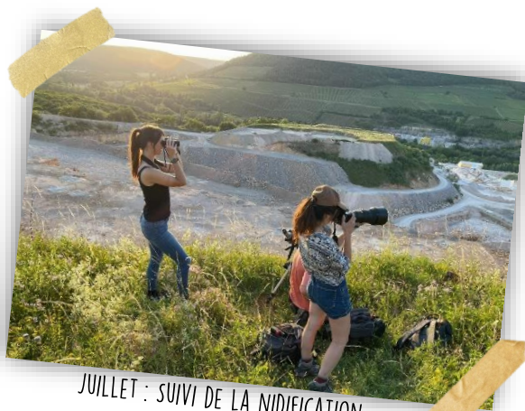
JUILLET : SUIVI DE LA NIDIFICATION DU GRAND-DUC D'EUROPE...

Zone de Protection Spéciale (ZPS) classée au titre de la Directive européenne « Oiseaux »