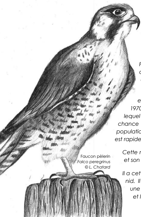
Faucon pèlerin Falco peregrinus

« Un des plus grand et redoutable chasseur d'oiseaux en vol »