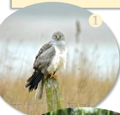
1 Busard Saint martin ( Cyrus cyaneus ), rapace typique des zones de cultures

Des pratiques agricoles inadaptées (usage excessif de pesticides ou fertilisants, monoculture intensive...) peuvent toutefois entraîner une dégradation des écosystèmes . Pour les éviter, des dispositifs de soutien à l'agriculture durable , tels que les contrats Natura 2000 , encouragent les agriculteurs à adopter des méthodes respectueuses de l'environnement tout en préservant leur activité économique.