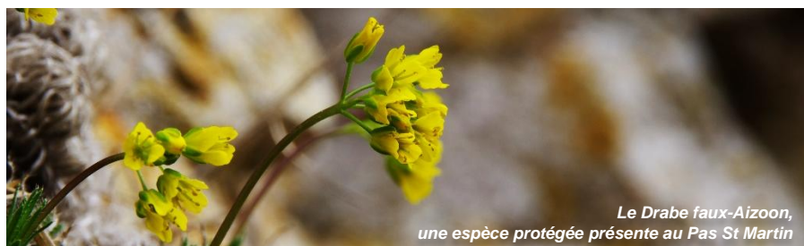
Le Drabe faux-Aizoön, une espèce protégée présente au Pas St Martin

Perché sur les hauteurs de Bouze-lès-Beaune, le Pas Saint Martin offre une vue spectaculaire sur la petite vallée de Mavilly-Mandelot. Ses falaises calcaires, riches en faune et en flore, accueillent le discret Faucon pèlerin, qui y est menacé. Un véritable refuge pour la biodiversité.