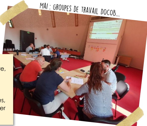
MAI : GROUPES DE TRAVAIL DOCOB...

Les connaissances acquises permettent de préserver en bon état les habitats d'intérêt communautaire face aux projets d'aménagement, et de mettre en œuvre des actions de gestion adaptées pour restaurer ceux dont l'état de conservation est dégradé.