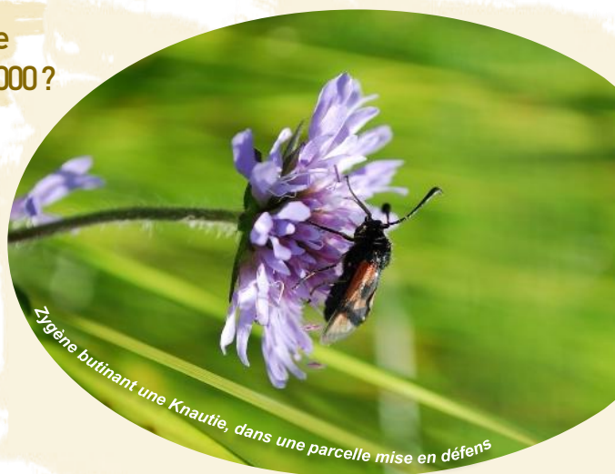
Zigène butinant une Knautie, dans une parcelle mise en défens

J'ai suivi des réunions publiques à titre personnel et des COPIL (ndlr : Comité de Pilotage) au nom du syndicat dans lequel je m'investis. J'essaie modestement de faire le lien entre le monde de la protection duquel nous provenons et le monde agricole duquel nous appartenons à présent.