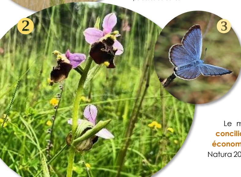
3 Azuré de la Croisette ( Phengaris alcon ), papillon rare qui ne survit que là où pousse la Gentiane croisette, typique des pelouses calcaires