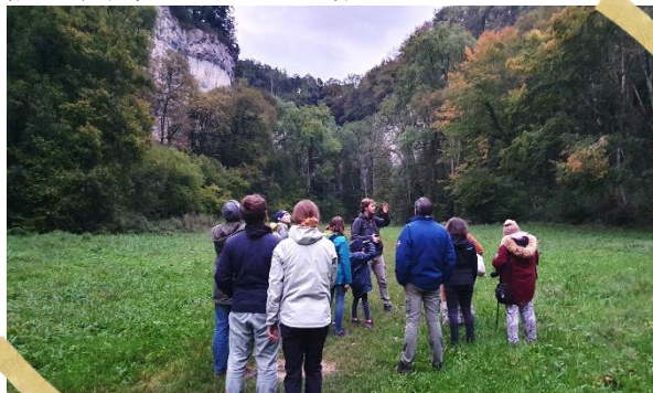
AU CIRQUE DU BOUT DU MONDE...